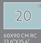
60X90 CM RC 23,6"X35,4"