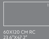
60X120 CM RC 23,6"X47,2"