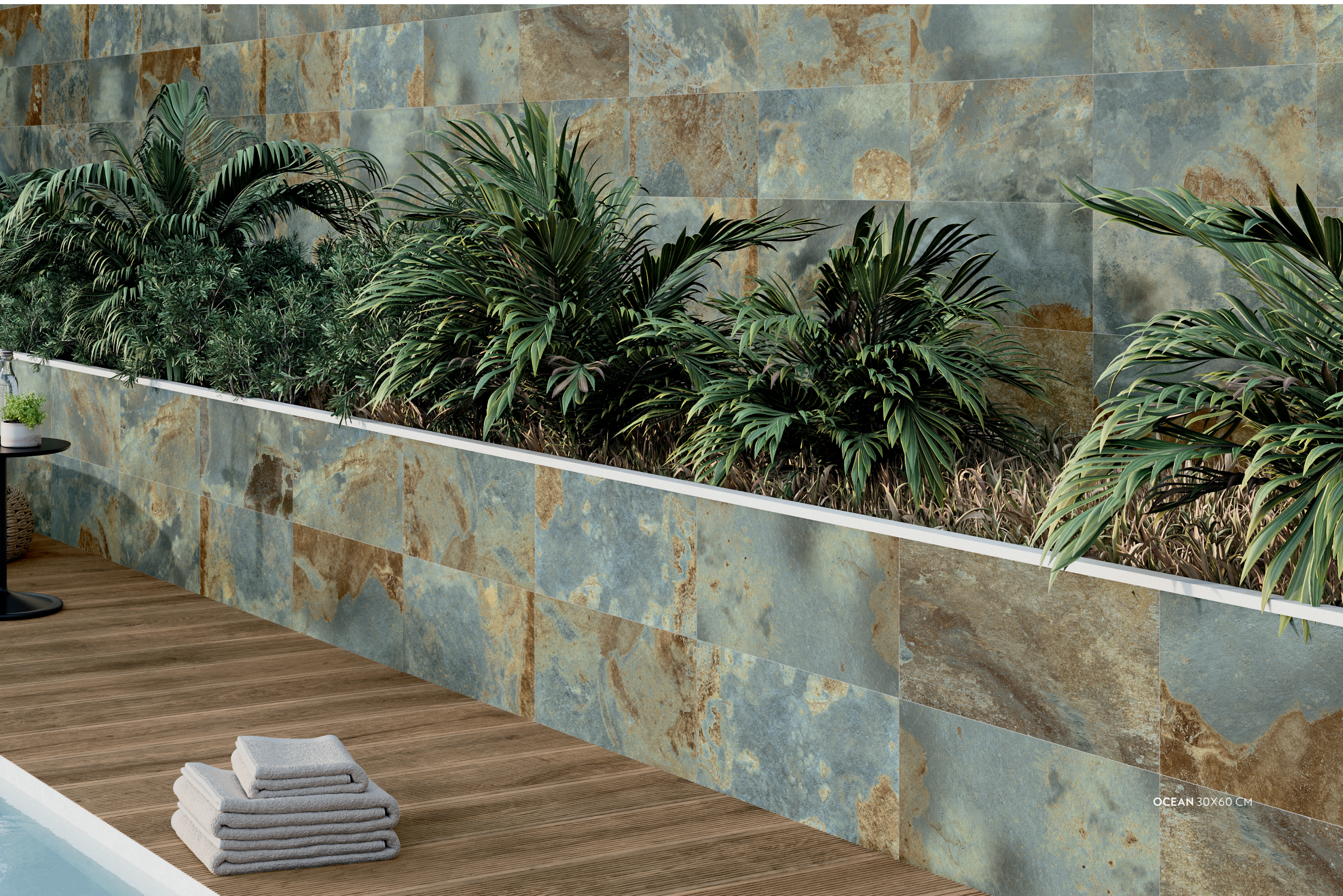
OCEAN 30X60 CM