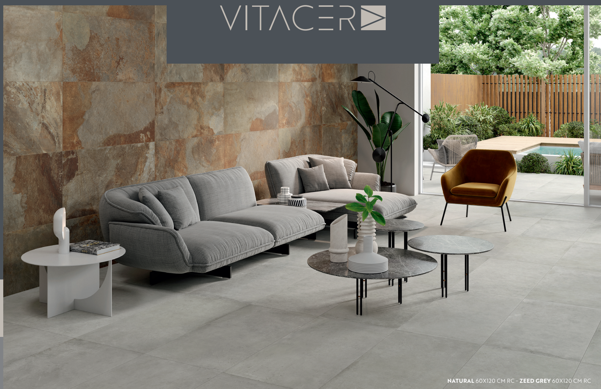
NATURAL 60X120 CM RC - ZEED GREY 60X120 CM RC